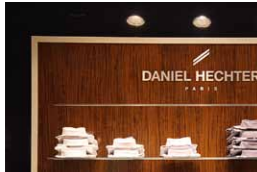
Glanzende vooruitzichten: Hansen herenkleding in Keulen

Glanzende tijden wachten op u: bij DecoBoard HG wordt de hoogste kwaliteit bereikt door de terugkoeltechnologie. Daartoe biedt Pflaenderer een veelvoud van dragers aan voor verschillende eisen, van P2 en MDF tot emissiearme, moeilijk ontvlambare of lichtgewicht uitvoeringen. In DST-systeem is hooglans combineerbaar met 180 decors.