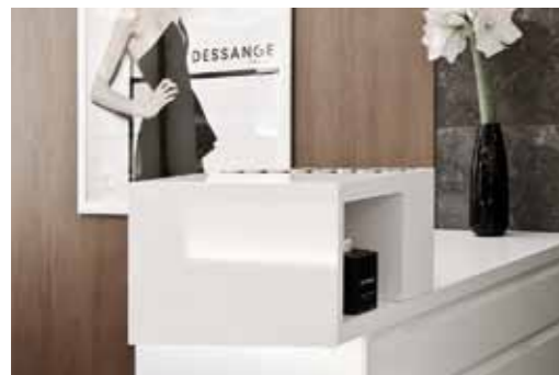
Glanzende vooruitzichten: Dessange salon, kapsalon, Wenen

Perfekte glans door perfecte verlijming: Duropal-HPL in kleurkoppeling met verschillende dragers bieden voor iedere eis de juiste oplossing. Bij HPL sandwichpanelen PUR ontstaat door de verlijming met Polyurethaan - smeltlijm een optimale rust aan het oppervlak met een maximale glansgraad. Daarnaast zijn ook Duropal-meubelelementen met hoogglans verkrijgbaar, sommige met hoogwaardige laserkanten.